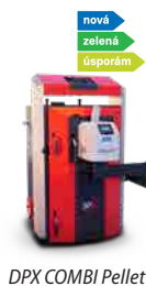
DPX COMBI Pellet